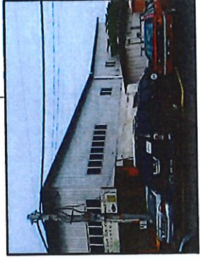
SELATAN: TANAH MILIK LOT 34 BANGUNAN KEDAI