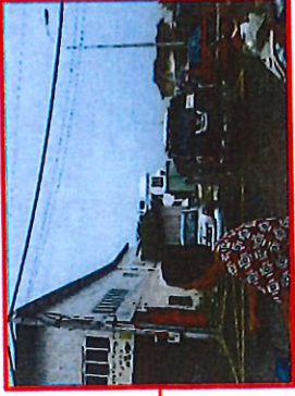
ATAS TANAH YANG DIPOHON TAPAK KOSONG PLOT A 77 MP.