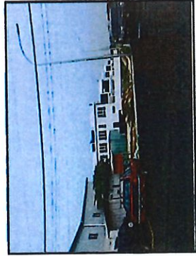
UTARA: TANAH MILIK LOT 11391 ( TAPAK KOSONG )