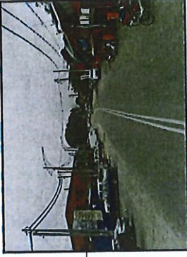
TIMUR: TANAH KERAJAAN SIMPANAN JALAN