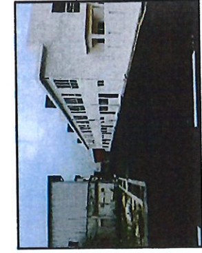
BARAT: SIMPANAN JALAN